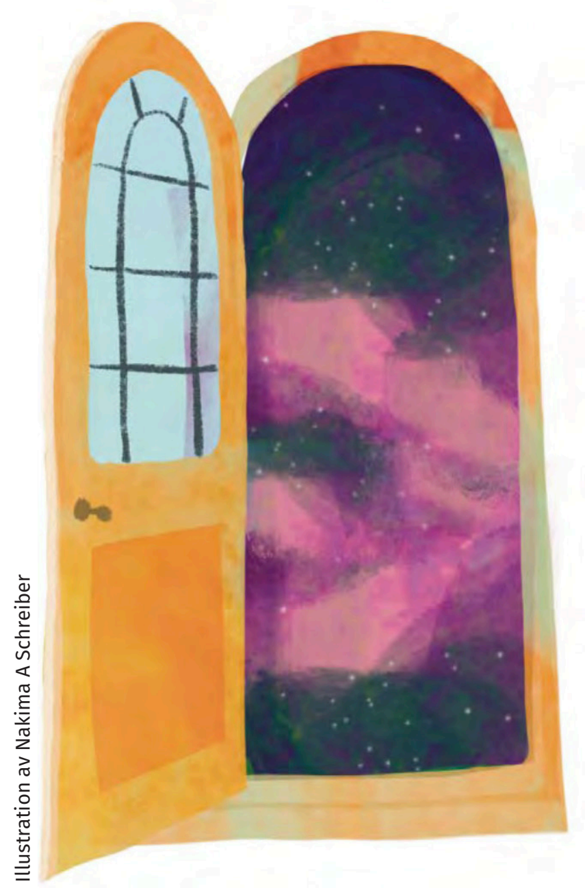
Illustration av Nakima A Schreiber