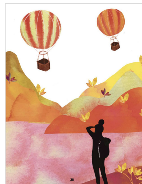
Illustration av Nakima A Schreiber

I detta labb som vi kallade delaktighetslabbet ville vi utforska vad begreppet delaktighet innebär för deltagare i verksamheter hos Stockholms stadsmission såväl som hos medarbetare. Förnyelselabbet var med och bistod att tänka kring upplägg, process och förhållningssätt.