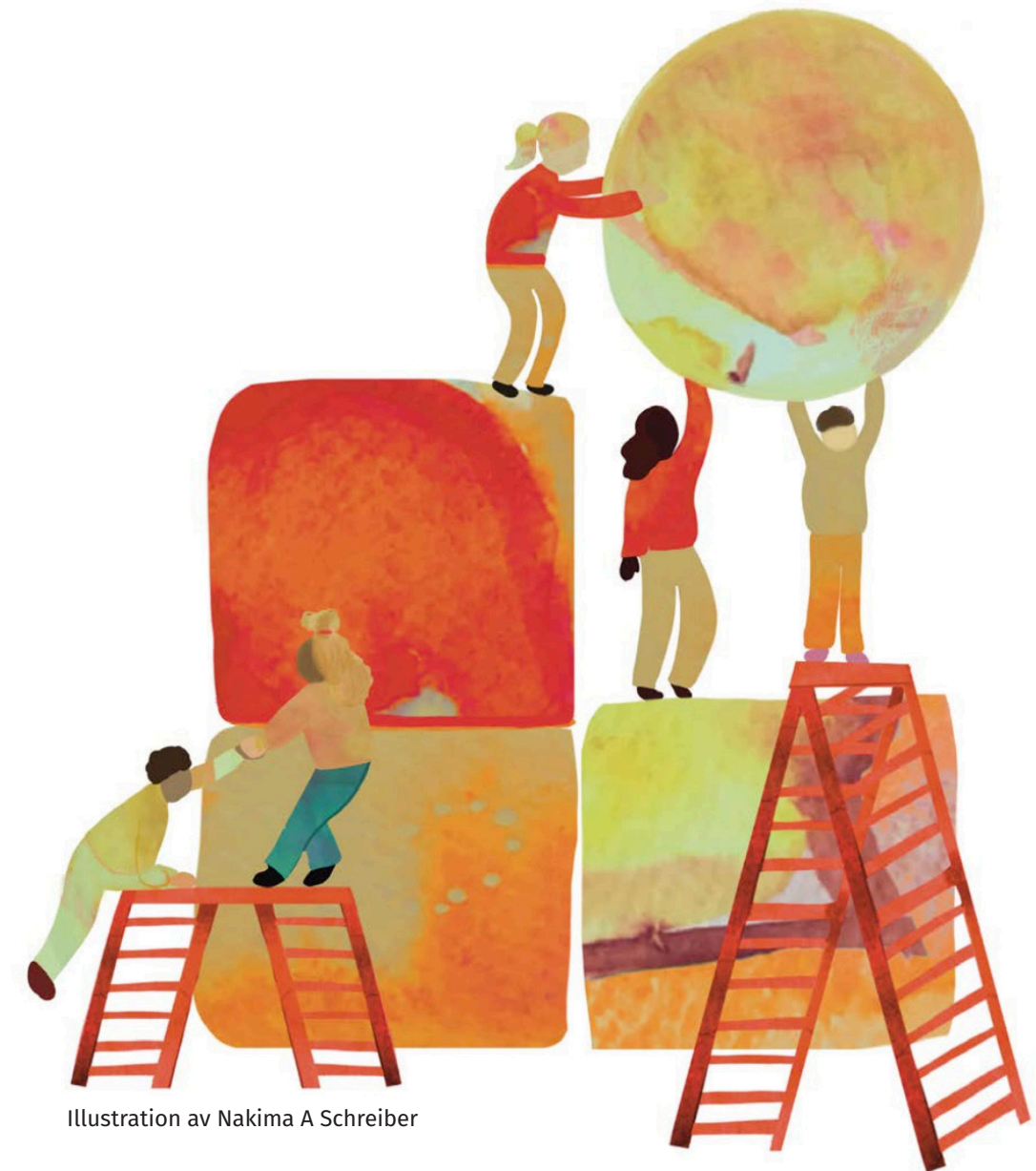
Illustration av Nakima A Schreiber

Vill du komma i kontakt? isabell.hedling@stadsmissionen.se pia@fornyelselabbet.se